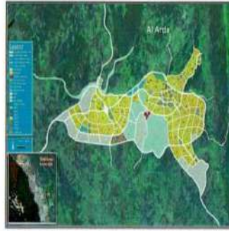
الموقع بالنسبة للمخطط العيكني

لا يرد جد سلطان عمراني معتمد والموقع ضمن القرى الموقق على تتمتعها من مجلس المنطقة