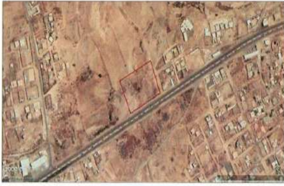
الموقع على العصور الخضراء